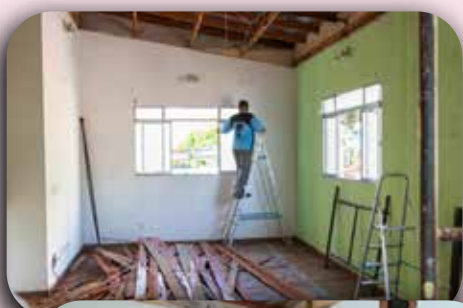
Início da reforma na cozinha da Casa dos Religiosos.