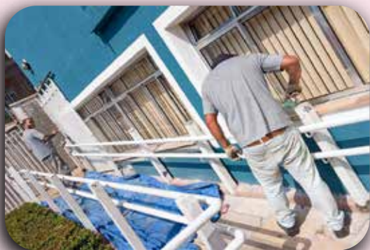
Pintura do corrimão na área externa do instituto.