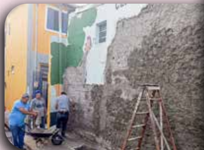
Progresso do reparo no muro da CEI São Francisco e início da pintura.