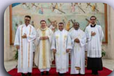
Dom Ângelo ao lado da comunidade religiosa do IMSJT na Capela São José.

IMSJT - Dom Ângelo, também no início do ano passado, o senhor foi nomeado presidente da comissão episcopal para os ministérios ordenados à vida consagrada na CNBB (A Conferência Nacional dos Bispos do Brasil). Recebeu também com surpresa?