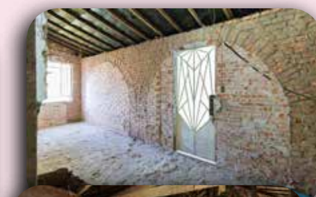
Andamento da obra do Memorial Padre Gregório.