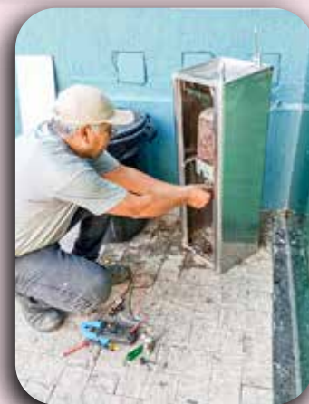
Manutenção do bebefouro ao lado da recepção.