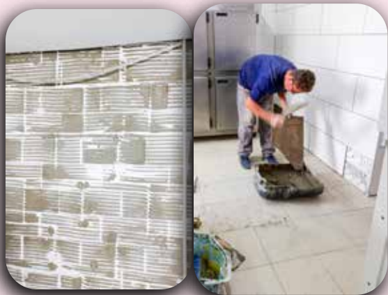
Remoção e instalação de revestimento na cozinha do CEI Sagrado Coração de Jesus.

O mês de julho foi de férias para nossos atendidos, porém por um período mais curto. Com as creches sem os pequenos foi mais fácil colocarmos as mãos à obra, e assim alguns CEIs (Centros de Educação Infantil) contaram com a manutenção devida. No CEI São Francisco algumas salas estão recebendo piso e paredes novas, além de ter sido iniciada a pintura da fachada da creche. Os banheiros do CEI Padre Gregório estão com novas bacias, pisos e azulejos. O refeitório dos religiosos na sede do IMSJT passa por uma grande reforma, onde os telhados também estão sendo substituídos, e alguns espaços de armários e pias precisaram ser trocados devido aos anos de uso. A obra do Memorial Padre Gregório segue a todo vapor. Contamos com a ajuda de nossos benfeitores, que contribuem com doações de materiais e apoio financeiro. Gratidão a todos vocês.