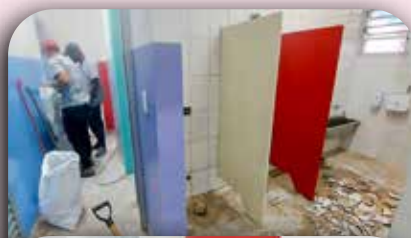
Reforma no banheiro superior do CEI Padre Gregório.