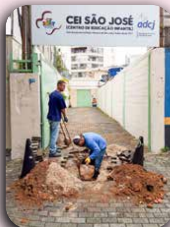
Vazamento na tubulação de esgoto na entrada do CEI São José.