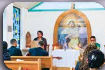
CEI Padre Dehon.