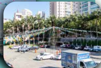
Decoração com as bandeirinhas.