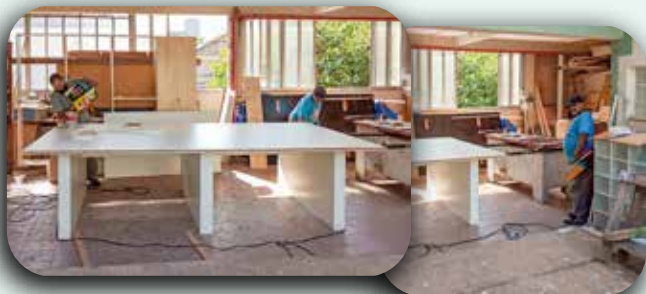
Fabricação de mesa para o Coser.