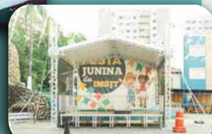
Montagem das barracas e do palco.