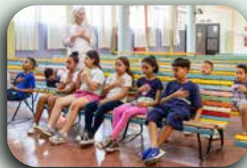
Catequese no CCA.