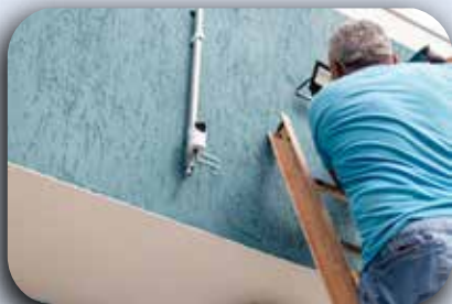
Trocas de luminárias externas da recepção.

As instalações da sede do IMSJT existem há mais de 75 anos, e por isso a manutenção do prédio precisa ser constante. A equipe está sempre vigilante para que reparos sejam realizados assertivamente, e neste mês foram realizados trabalhos pontuais em nossa sede, como: troca de luminárias, manutenção no estacionamento, da sala de confissões e da parede na área de reciclagem. E novidades estão por aí: vamos começar a desenvolver um projeto de comunicação visual nos muros de nossas creches, utilizando os mascotes do IMSJT. Nesta nova empreitada, contamos com o apoio de nossos benfeitores, que nos ajudam a manter essa obra há tantos anos na cidade de São Paulo.