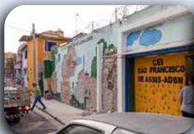
Reforma no muro da CEI São Francisco.