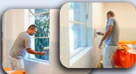
Pintura da sala de confissões.