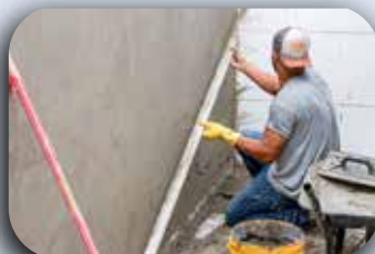
Reboco da parede na área de reciclagem.