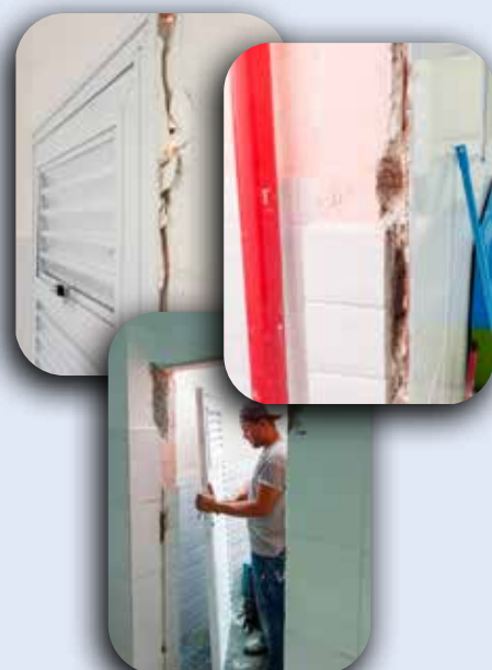
Troca de porta da CEI São José.