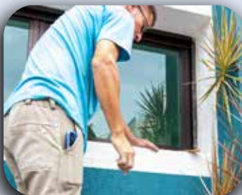
Manutenção da entrada na área do estacionamento.