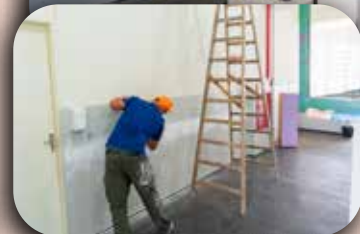
Reparo no corredor do CCA.