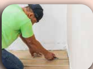
Troca de piso no estúdio do instituto.