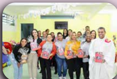
CEI Sagrado Coração