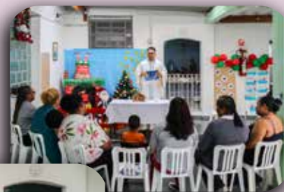
CEI São José