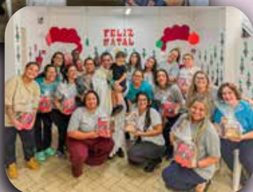
CEI Sagrada Família