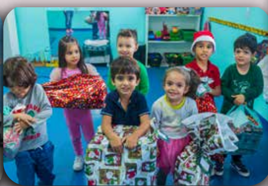
CEI Padre Gregório