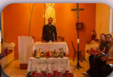
CEI Padre Gregório