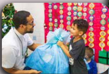
CEI Mãe Operária

A direção do Instituto Meninos de São Judas Tadeu agradece, de coração, a todos os benfeitores e amigos que nos ajudaram a transformar o Natal de mais de 2.000 crianças em um momento inesquecível. Graças à generosidade de cada um, nossa campanha foi um grande sucesso! As sacolinhas foram retiradas e devolvidas ainda em novembro, o que nos permitiu organizar com carinho a entrega dos presentes. Cada unidade do Instituto realizou a entrega em um dia especial, repleto de sorrisos e acompanhado de um delicioso almoço natalino preparado especialmente para os pequenos. Muito obrigado a todos que se uniram a nós nessa missão de espalhar amor e alegria. Que Deus abençoe cada gesto de solidariedade e cada coração que se dispôs a fazer uma criança sorrir neste Natal.