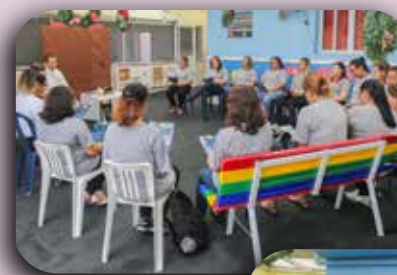
CEI São Francisco