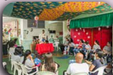
CEI João Paulo II