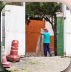
Abertura de novo portão na Av. Piassanguaba.