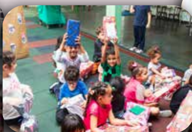
CEI São José