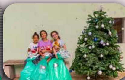
CCA Padre Gregório