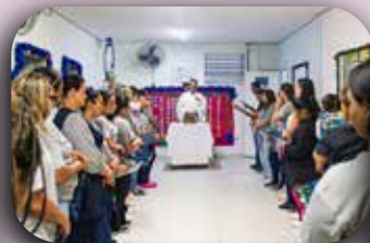
CEI Mãe Operária