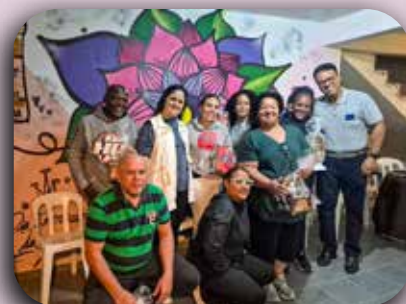
SAICA Pe. Dehon