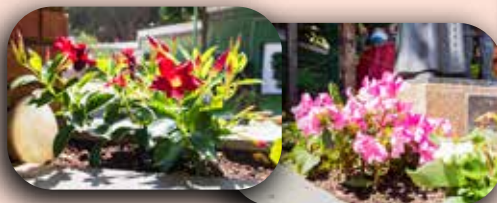
Ornamentação com flores.