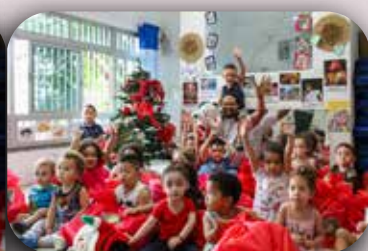
CEI Sagrada Família