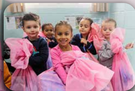
CEI Sagrado Coração de Jesus