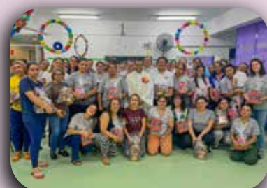
CEI Santa Catarina