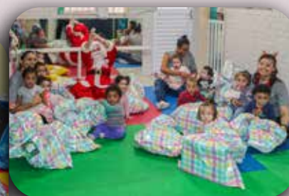
CEI São Francisco de Assis