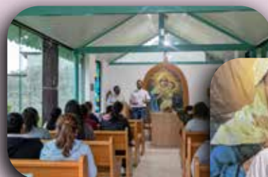
CEI Padre Dehon