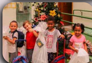
CEI João Paulo II