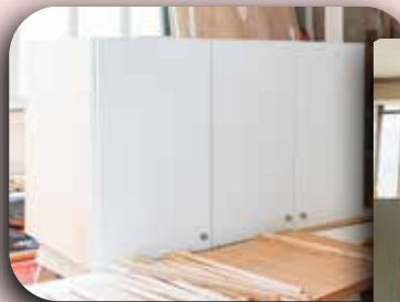
Móveis para os SAICAs.

Muitos trabalhos foram realizados pela equipe de manutenção do Instituto em janeiro de 2025, com atenção especial às nossas unidades educacionais e sociais. No CCA Padre Gregório Westrupp (Centro para Crianças e Adolescentes), foram feitos pequenos reparos, e os corredores receberam uma nova pintura. A marcenaria também se dedicou e concluiu os armários para os SAICAs (Serviço de Acolhimento Institucional para Crianças e Adolescentes) São Judas Tadeu e Padre Dehon. Na sede do IMSJT, o centro de distribuição passou por uma substituição no forro e reparo na parte elétrica. O teto do estúdio, onde são realizadas as gravações, também ganhou nova pintura. Confira as fotos abaixo.