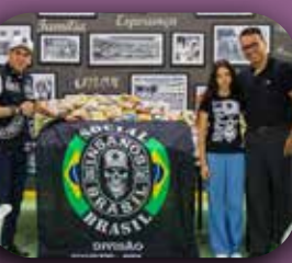
Doação da Polícia Civil do Estado de São Paulo.