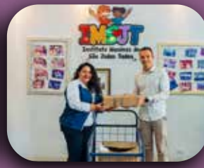
Notebooks doados pelo Instituto Lapin.