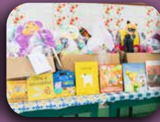
Colégio Santa Maria.