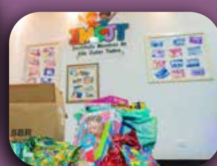
Doação de brinquedos da Local Imóveis.