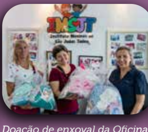
Doação de enxoval da Oficina de Caridade Santa Rita de Cássia.