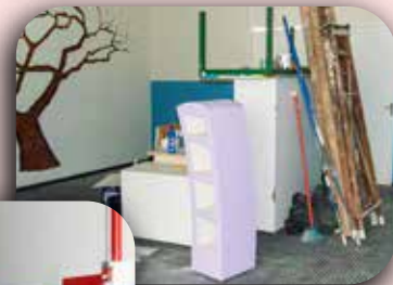
Pintura do Corredor do CCA.