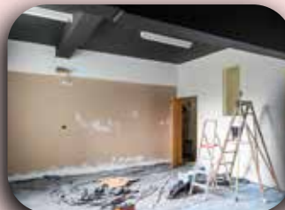
Pintura do teto do estúdio no instituto.