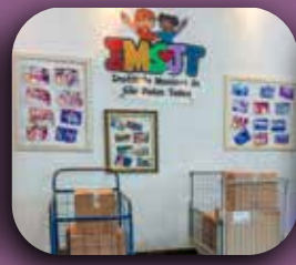
Doação de Clínica médica CCB.